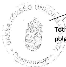
Tóth Gábor polgármester